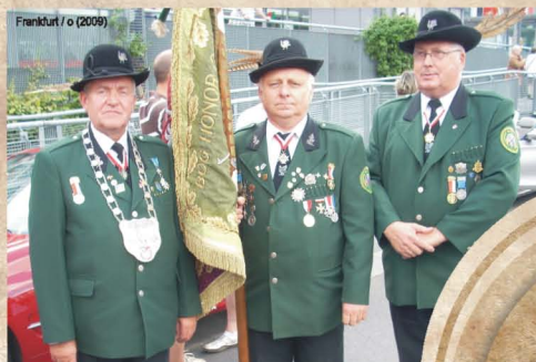
Frankfurt / o (2009)